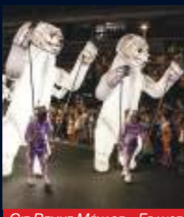
CIE REMUE MENAGE - FRANCE