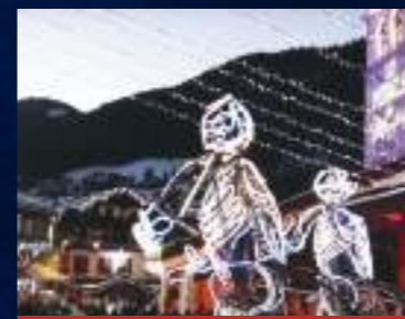
EL SINDICATO DE MONSTRUOS - ESPAGNE

La sonde spatiale Voyager 1 a parcouru des milliards de kilomètres et dans son long voyage dans l'immensité de l'univers, elle a trouvé ses premiers invités ; des êtres de lumière d'une constellation très lointaine. Ceux-ci sont venus sur terre pour partager une autre façon de voir et de ressentir la Lumière.