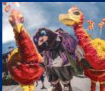
EL SINDICATO DE MONSTRUOS - ESPAGNE

Ces monstres s'inquiètent de la façon dont les humains traitent les animaux. Par conséquent, Sargon l'explorateur raconte l'importance qui existe entre les humains et leurs compagnons canins.