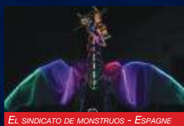
EL SINDICATO DE MONSTRUOS - ESPAGNE

Deux créatures ailées arrivent à La Clusaz, pleines de couleurs vives et de sons extravagants, pour vous aider à prendre votre envol vers le monde de l'imagination.