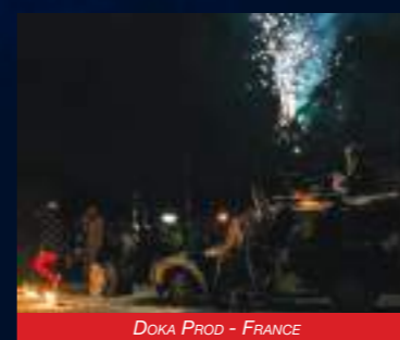
DOKA PROD - FRANCE

Née de la rencontre entre un artiste, une Citroën Acadiane et un Maître Artisan bourellier, l'Akavaka est un subtil mélange de mécanique, de décibels et de cuir avec plus d'une corne à son arc. Cette disco-mobile déjantée offre une touche musicale originale et décalée garantie 100% Reblochonland.