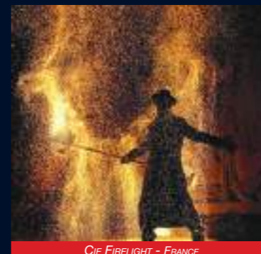
CIE FIRELIGHT - FRANCE

Associant des performances ultra-visuelles telles que la manipulation d'objets enflammés, la pyrotechnie et la jonglerie lumineuse, ce spectacle riche en couleurs vous surprendra par ses qualités techniques et esthétiques.