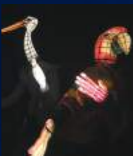
CIE CARAMANTRAN - FRANCE

Le célèbre professeur Ambroise Pinson arrive en ville. Expert en gazouillis, piailllements et autres ramages, il est à l'affût du moindre plumage. Rapaces, échassiers, passereaux, oiseaux des îles ou de nos contrées, ils seront tous là pour célébrer cette fin d'année avec vous !