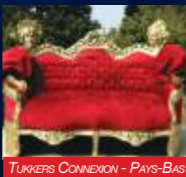
TUKKERS CONNEXION - PAYS-BAS