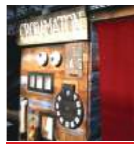
T. AGNELLET - FRANCE

Mise au point par un savant fou, cette machine un peu dégingue est constituée d'une multitude de mécanismes qui grincent, pendulent et clignotent... Reprenant le principe du photomaton, le Crobamaton ne fait pas de photos mais produit de petits dessins !