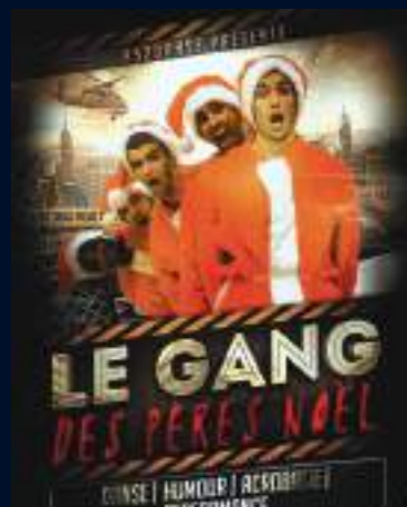
CIE AS2 DANSE - FRANCE

Vibrez au rythme des aventures de ces pères-Noël pas vraiment comme les autres... Un show à couper le souffle mêlant humour, danse, et acrobaties. Chorégraphies punchy, mises en scène recherchées et figures techniques renversantes... les As2Danse abattent leurs cartes et sortent le grand jeu !