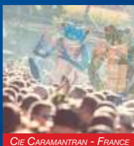
CIE CARAMANTRAN - FRANCE

Les ElectRo' FrOgs font irruption dans la ville et l'illuminent de mille couleurs électriques. Véritables lanternes magiques épileptiques, ces amphibiens débouillonnés sont accompagnés par un aimable trio de saxophones rutilants.