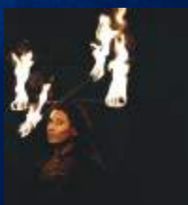
CIE FIRELIGHT - FRANCE

Associant des performances ultra-visuelles telles que la manipulation d'objets enflammés, la pyrotechnie et la jonglerie lumineuse, ce spectacle riche en couleurs vous surprendra par ses qualités techniques et esthétiques.