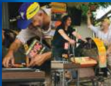
CIE DYNAMOGÈNE - FRANCE

Ami(e)s cyclistes mélomanes, bienvenue à l'Athlétic-Cyclo-Disco-Club ! Cette machine fonctionne exclusivement à l'énergie musculaire ! Pendant que 2 personnes s'activent au pédalage et à la manivelle, d'autres fouillent dans les bacs à la recherche de leur morceau favori.