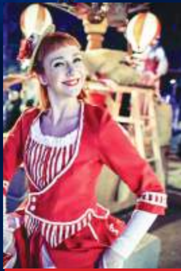
CIE LES ENJOLIVEURS - FRANCE