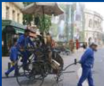
CIE DYNAMOGÈNE - FRANCE

Les artistes-ouvriers des Ets DYNAMOGÈNE en délégation syndicale officielle viennent vous présenter "Le Rotocloche". Un engin musical hybride dont l'esthétique utilitaire s'inspire furieusement du machinisme agricole des années folles.