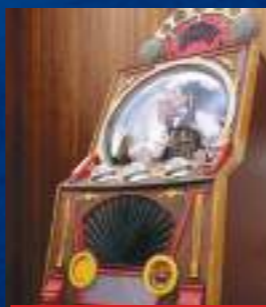
TUKKERS CONNEXION - PAYS-BAS

Il a l'apparence d'une machine à sous des années folles mais, de l'intérieur, il est plein d'ingéniosité humaine. Insérez une pièce, tirez sur la poignée et la machine se mettra à tourner. Un par un, trois caractères bizarres passeront. Trois caractères identiques ? C'est le JACKPOT !