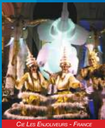
CIE LES ENJOLIVEURS - FRANCE

Cette parade insolite, où les différentes disciplines artistiques se croisent et s'invitent à tour de rôle, est digne d'une des plus belles scènes de film, inspirée du « Bollywood Indien ».